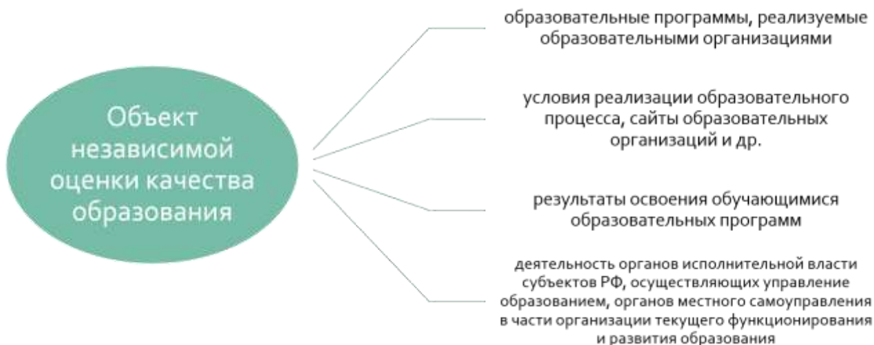
Рисунок 5 – Объекты независимой оценки качества образования

На уровне региона, муниципального образования также может быть востребована сравнительная оценка (рейтинг) образовательных организаций.