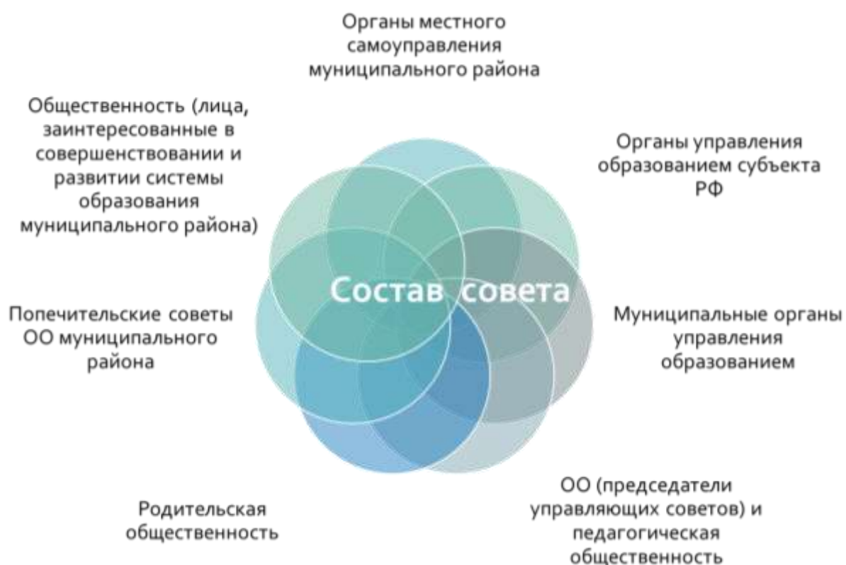
Рисунок 4 – Состав совета

районное родительское собрание; районный совет старшеклассников муниципального района; районная ученическая конференция; совет председателей управляющих советов; управляющий совет малокомплектных сельских школ; управляющий совет системы образования муниципального района.