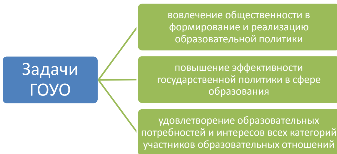
Рисунок 1 – Задачи ГОУО

Выделены три основные задачи ГОУО, показанные на рисунке 1.