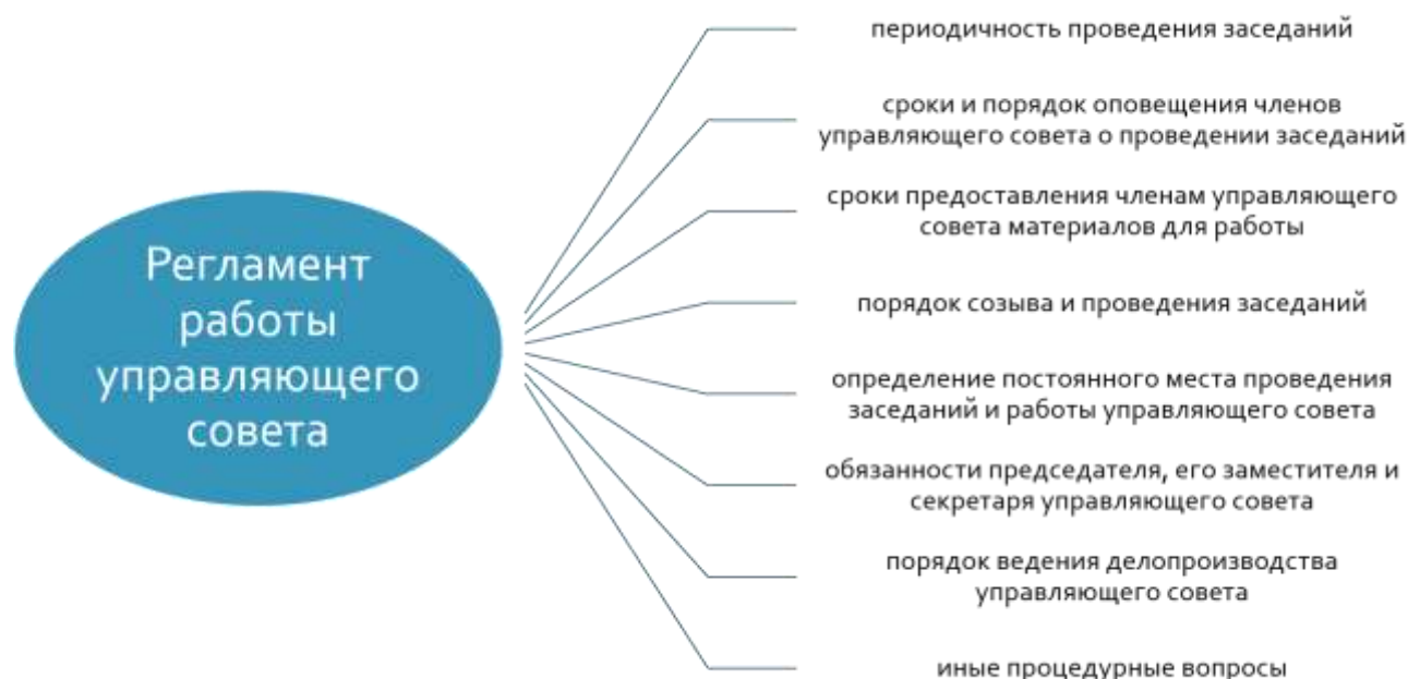
Рисунок 3 – Регламент работы управляющего совета

Для более подробной регламентации процедурных вопросов порядка своей работы управляющим советом разрабатывается и утверждается регламент работы управляющего совета (рисунок 3) [23].