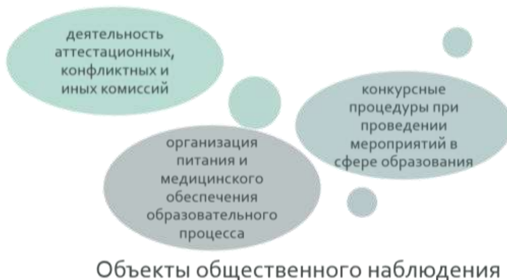
Рисунок 6 – Объекты общественного наблюдения

Органами управления образования субъектов Российской Федерации разрабатывается Положение об организации системы общественного наблюдения применительно к каждой процедуре (объекту) наблюдения. Каждая из указанных процедур имеет свою специфику, определяющую особенности работы общественных наблюдателей.