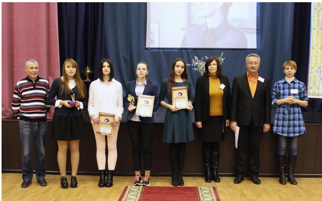
Награждение победителей конкурса «Литературное творчество» (10-11 класс)